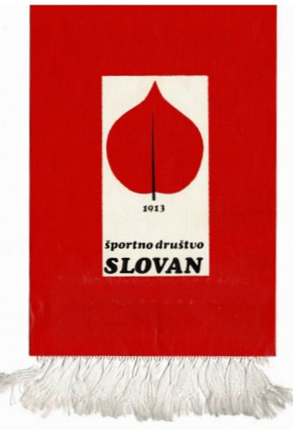
Sonja Završnik Podlesek