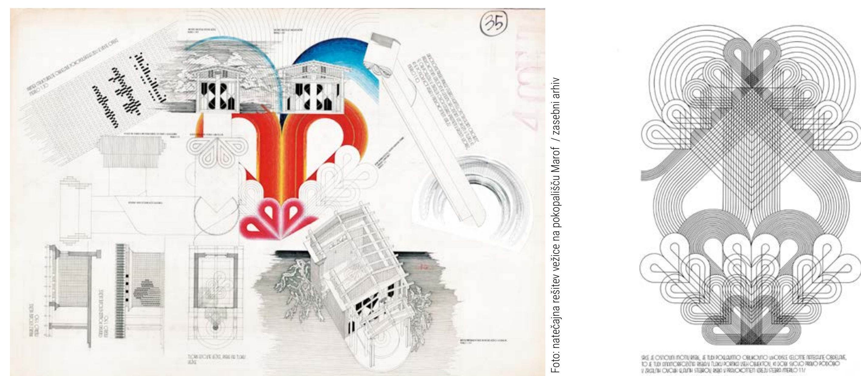
Foto: natečajna rešitev vežice na pokopališču Marof