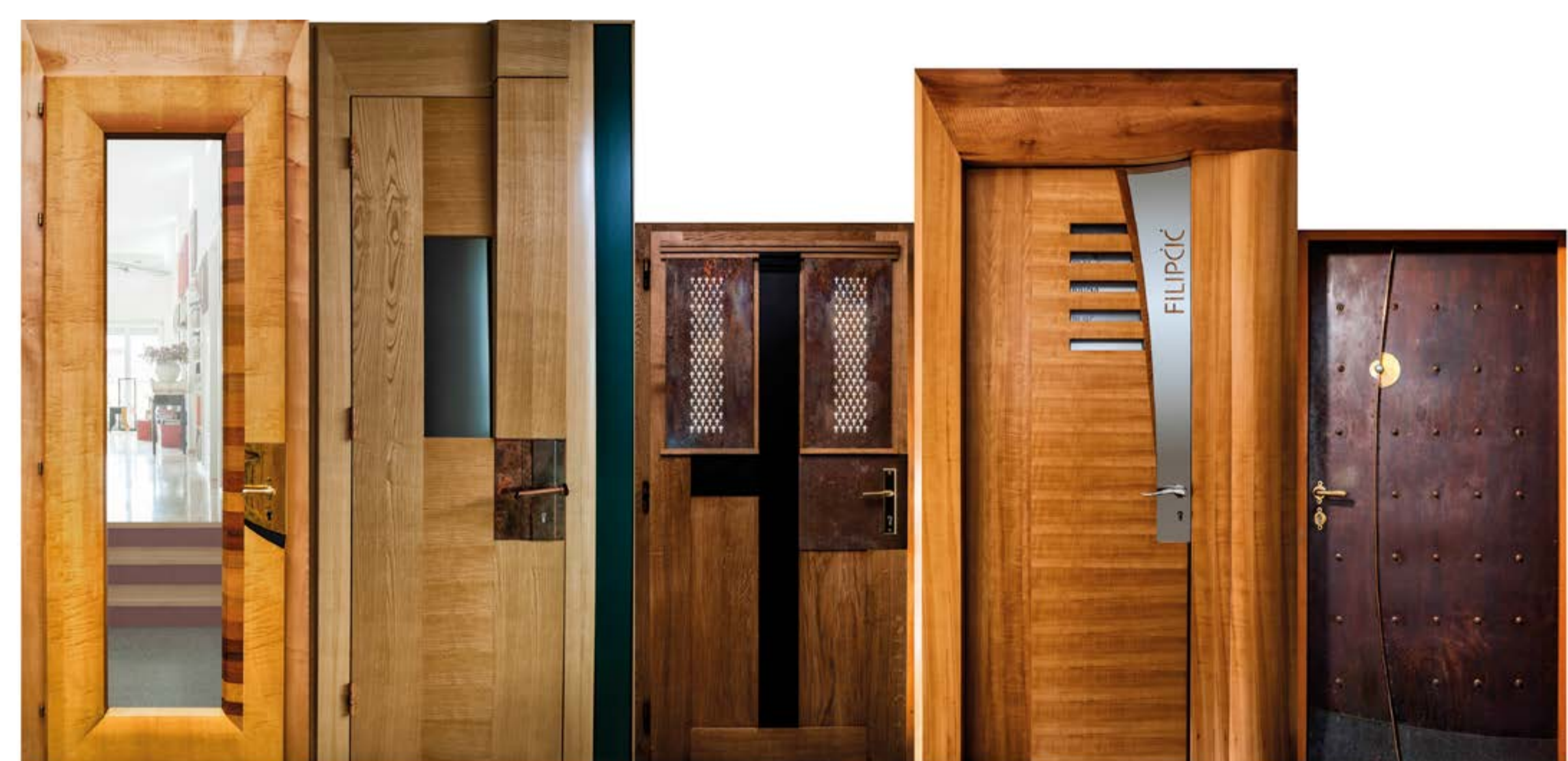
Foto: Oblikovanje vrat kot unikatnega pohištva / zasebni arhiv Evite

Sveto pismo predstavlja verjetno najzahtevnejšo tipografsko nalogo, ki lahko doleti grafičnega oblikovalca. Pripomba se nanaša na velikost in zahtevnost naloge. Na vsemogoče načine členjenju tvarino je avtorica večje in z neverjetno zagnanostjo prignala do vrhunca in zato ni naključje, da je dobila za to delo najvišja možna priznanja: nagrado za najlepšo slovensko knjigo 2010 na Slovenskem knjižnem sejmu in priznanje odličnosti na 5. Brumnovem bienalu.