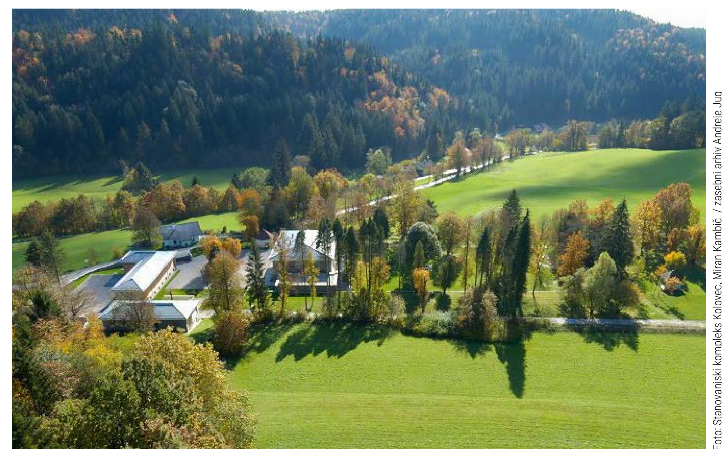
Foto: Stanovanjski kompleks Kolovec, Miha Kerin / Zasedba arh. Andreja Jug