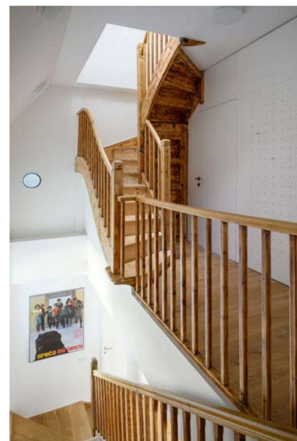
Foto: Stanovanjska hiša na Viču, Miha Kerin / Zasedba arh. Andreja Jug