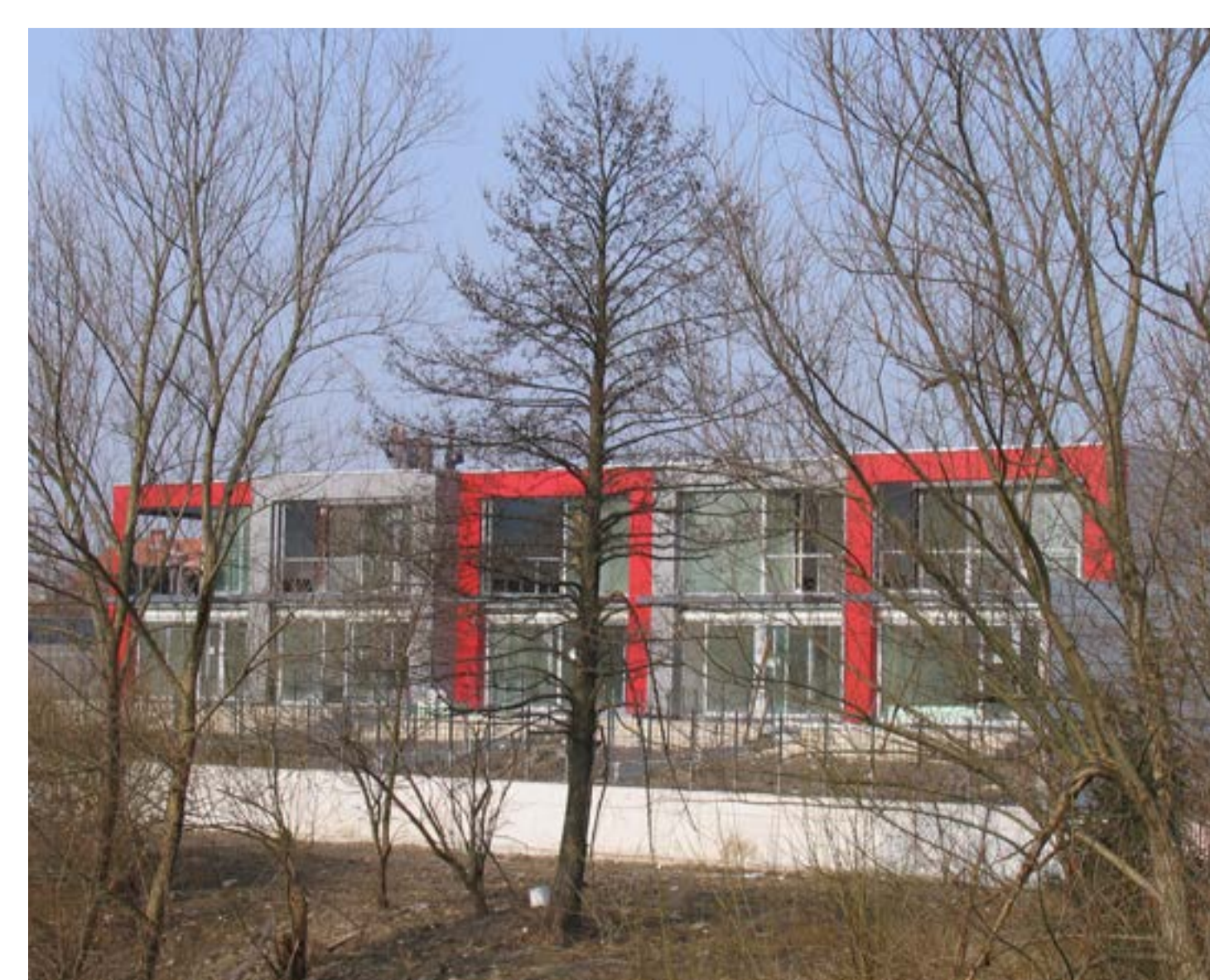
Foto: Vrstne hiše Mali Graben, Určjan Aringer / zasebni arhiv Jadranske Grmek