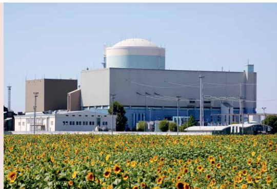
Edita Sovinc (Ljubljana, 1926–1978)