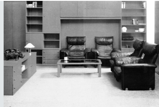
Ljerka Finžgar (Zagreb, 1937)