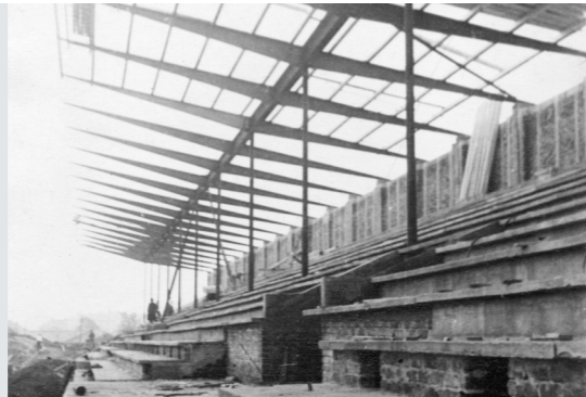
Carmen Jež Gala (Beograd, 1925 – Ljubljana, 1965)